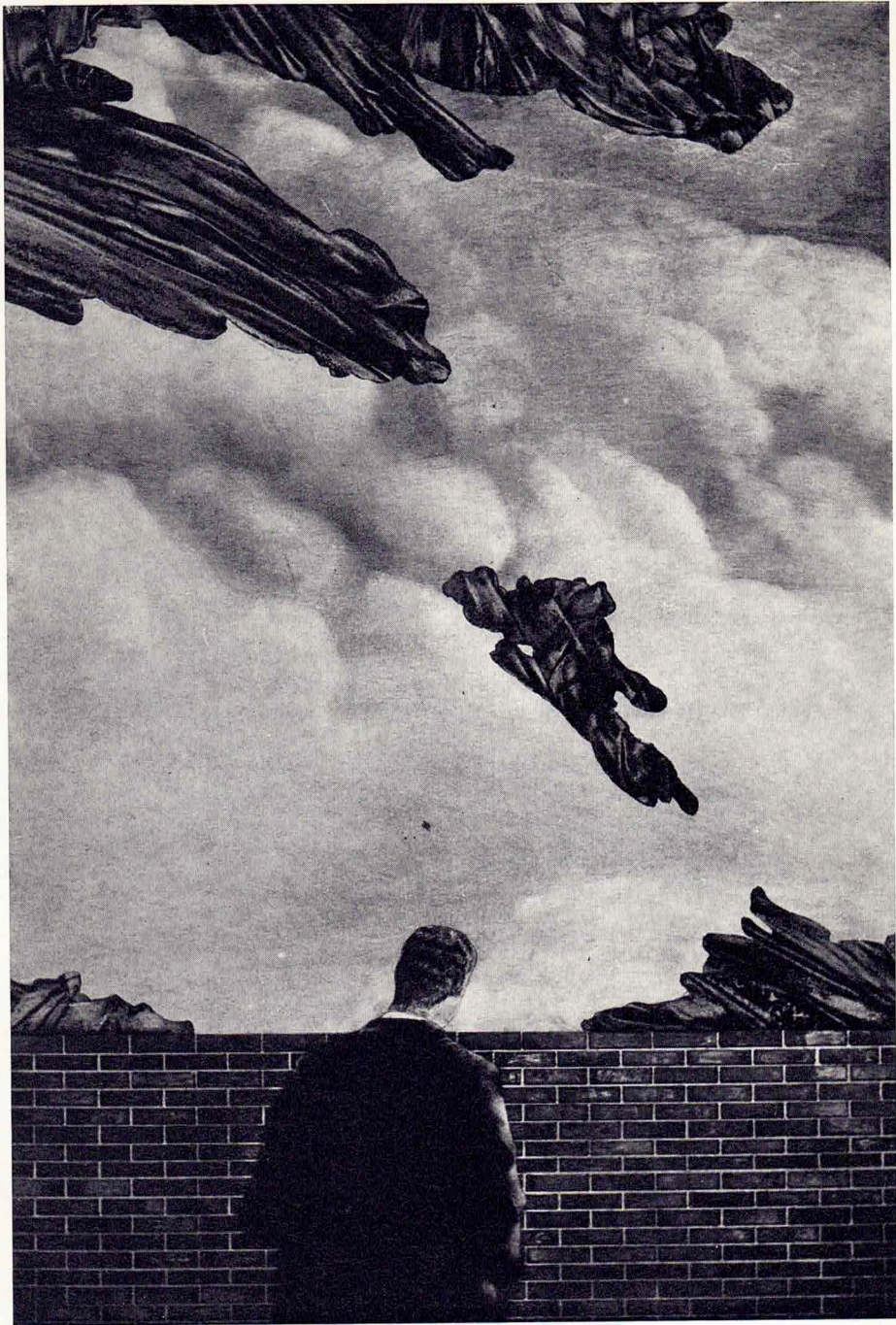
premonición 60 x 40 cm. técnica mixta sobre papel