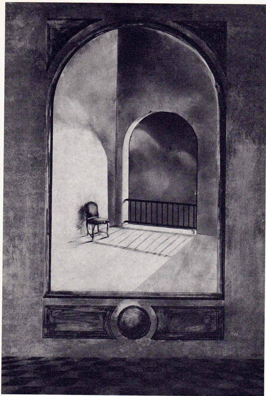
lugar sin acontecimientos 60 x 40 cm. técnica mixta sobre papel