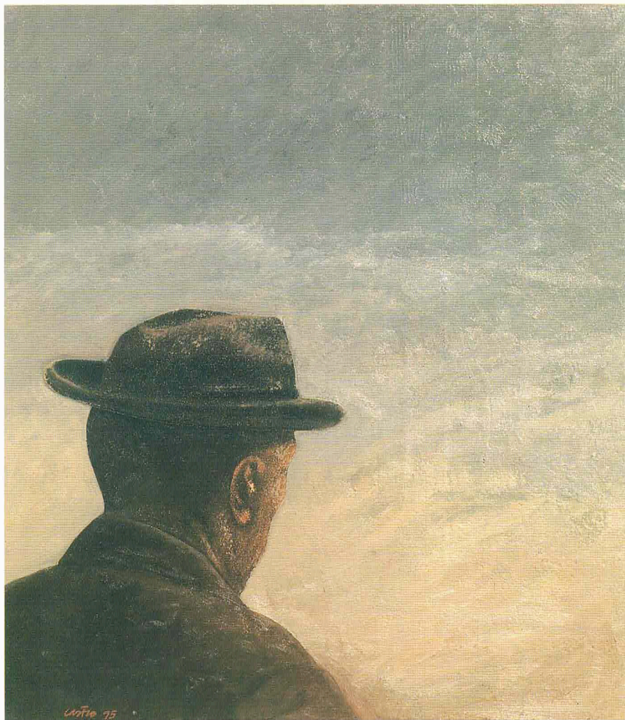
El regreso, 1995